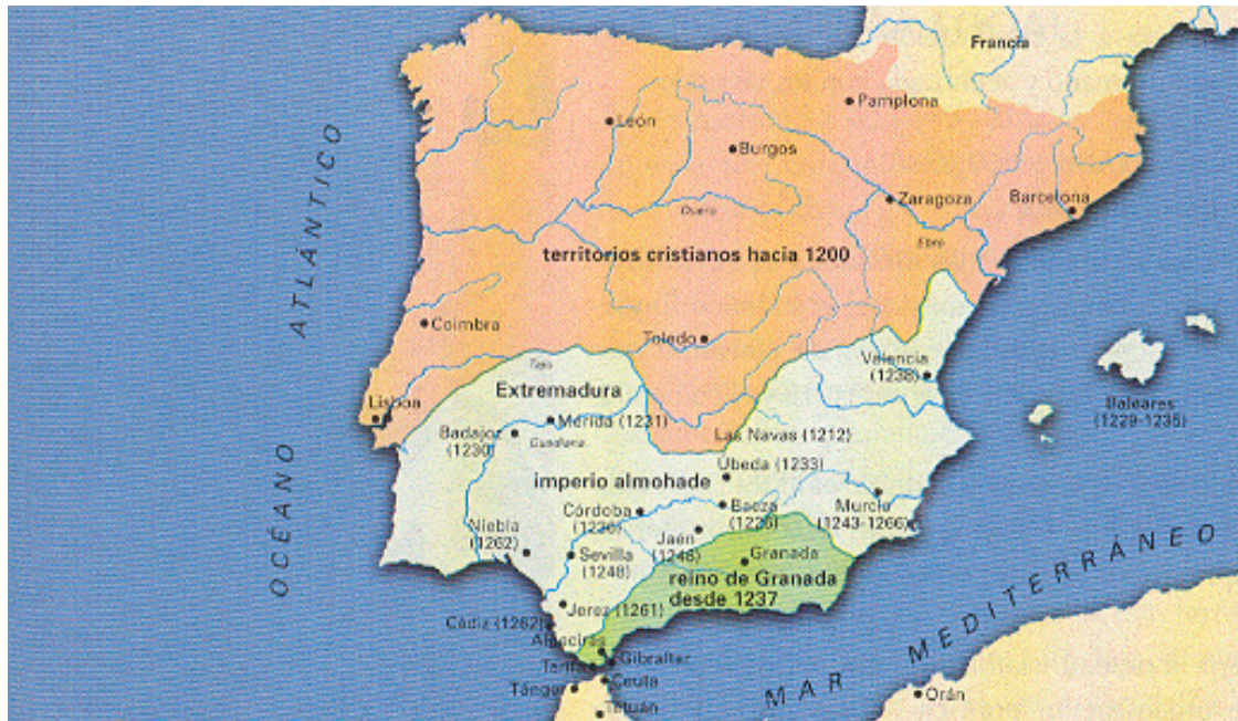
Mapa de al-Andalus a principios del siglo XIII

* A partir de sus conocimientos y del material adjunto desarrolle el tema :