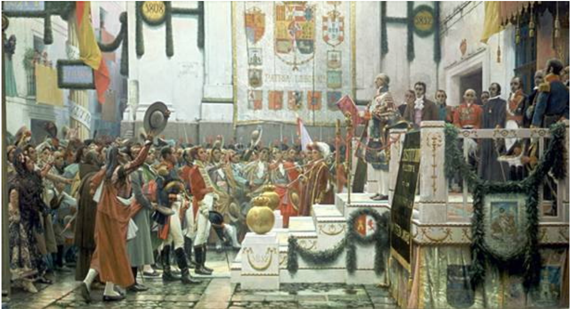
Proclamación de la Constitución de Cádiz, por Salvador Viniegra

* A partir de sus conocimientos y de los materiales adjuntos, desarrolle el tema :